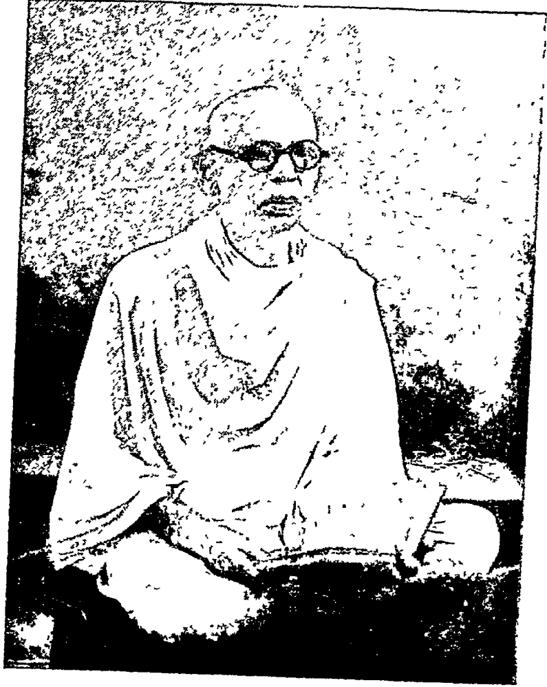
स्व न्न जीवराज गौतमचंद दोषी स्व. रो ता १६-१-५७ (पीप शु १५)